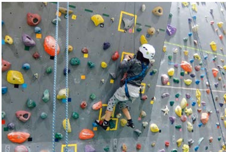
青少年館「トッパークライミング」