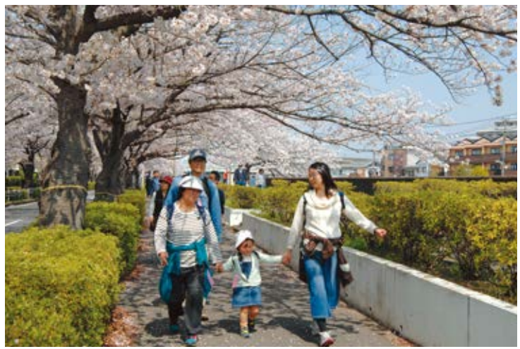
市民スポーツ課「花見ウォーク」