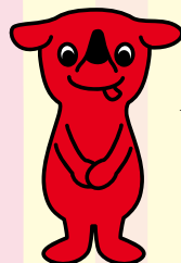
千葉県PRマスコットキャラクター チーバくん

今年も、公民館や博物館などたくさんの施設で、いろいろなイベントをします！！ 6月15日の県民の日は、「うらやすまるごとこども広場」に参加して楽しんじゃおう！！